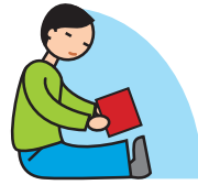
Manque de jeux imaginatifs