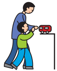
Indique ses besoins en utilisant la main d'un adulte