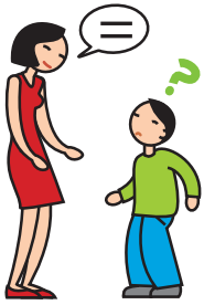
A du mal à comprendre et à se faire comprendre