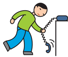
Utilise les objets de façon atypique