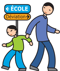
N'apprécie pas les changements