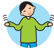
Présente des comportements bizarres