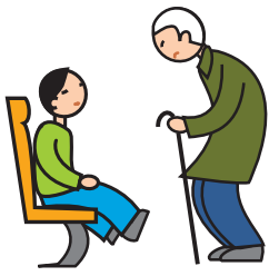
Comprend mal les conventions et les règles sociales