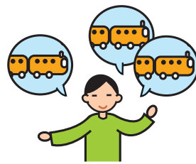
Parle de façon incessante sur un sujet particulier