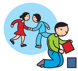
Ne joue pas avec les autres enfants