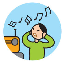
Peut être hypersensible aux sons, aux odeurs ...