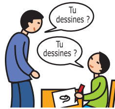
Utilise le langage de façon écholalique