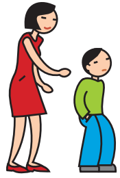
Manifeste de l'indifférence