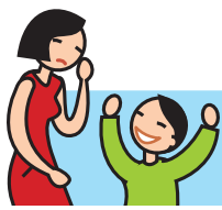
Rit de façon inappropriée